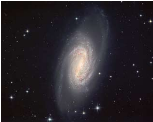
Galaxie „NGC 2903“ aufgenommen durch das 80-Zentimeter-Cassegrain-Teleskop der Sternwarte Zollern-Alb

Der Steuerrechner des Teleskops wird hierzu direkt an den Server der Sternwarte angebunden und gestattet so die vollständige Steuerkontrolle – über Teleskop, angeflanschte Kameras, Filterräder und weiterer Komponenten.