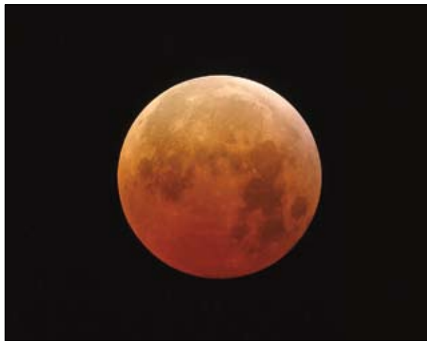
Mondfinsternis – bald auch online

Aufgrund des anhaltend starken Interesses gibt es mittlerweile im Schnitt an 4,5 Tagen pro Woche Führungen – Tendenz steigend. Die Führungen starten mit einer moderierten Multi-Media-Show, in die unter anderem Videos, Computer-Animationen, Live-Bilder vom optischen Fernrohr und Live-Sounds vom Radioteleskop einfließen. Danach können die Besucher die Himmelsobjekte mit verschiedenen Teleskopen beobachten. Wer möchte, kann natürlich auch die technischen Einrichtungen, wie den Steuerraum der optischen Teleskope oder die Empfangsanlagen der Radioantennen, besichtigen.